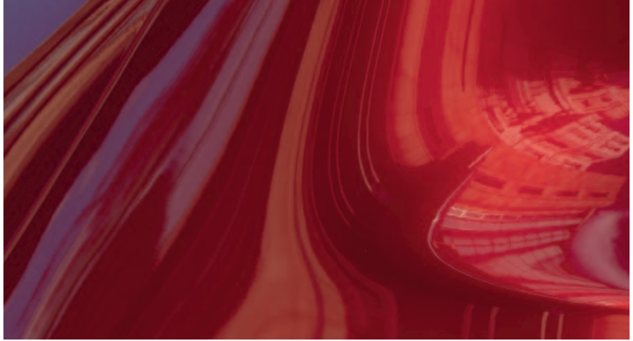
Soul Red Crystal