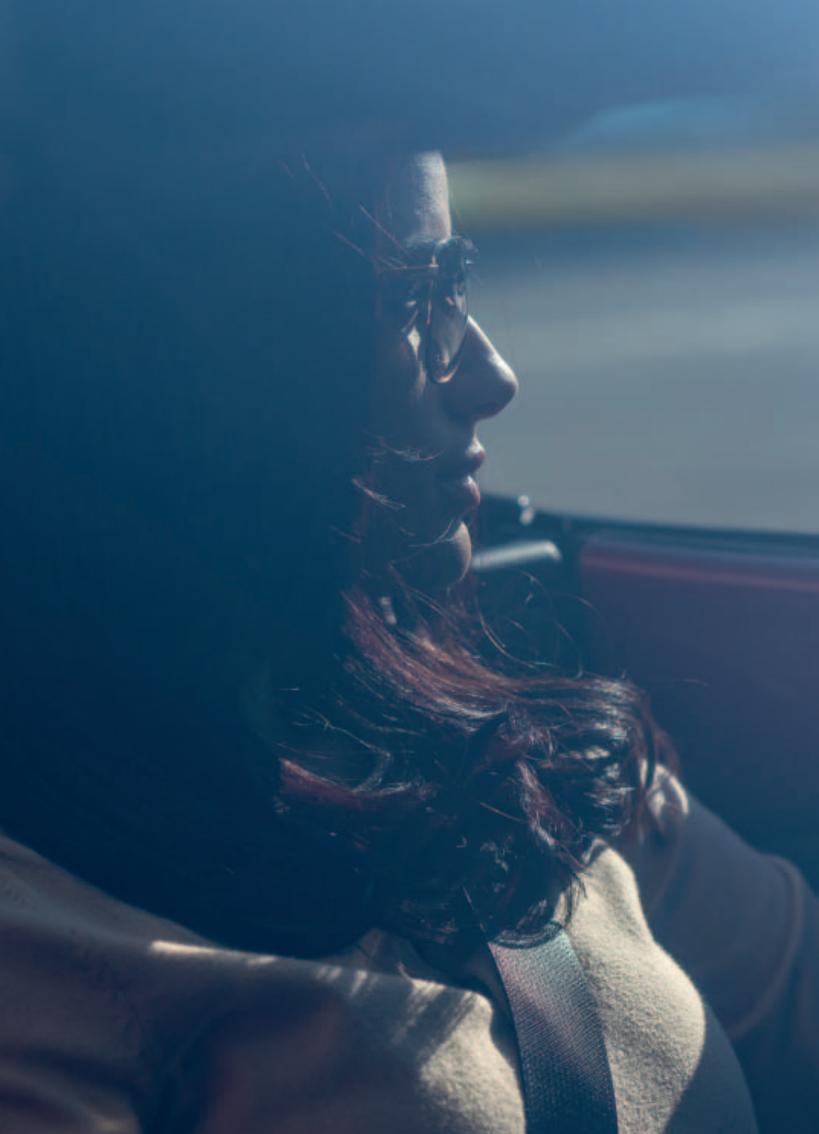
Foto rechts: Mazda MX-5 Roadster als GT-M uitvoering in Soul Red Crystal