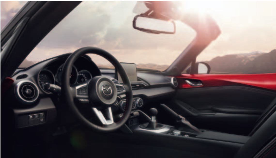
Foto links: Interieur Mazda MX-5 Roadster als GT-M uitvoering in Soul Red Crystal

Een hoogwaardig design waarin de inzittenden centraal staan. Vakmanschap van het hoogste niveau. Een indrukwekkende wendbaarheid. Geavanceerde veiligheidsfuncties. Daarom maakt Mazda auto's: voor puur rijplezier.