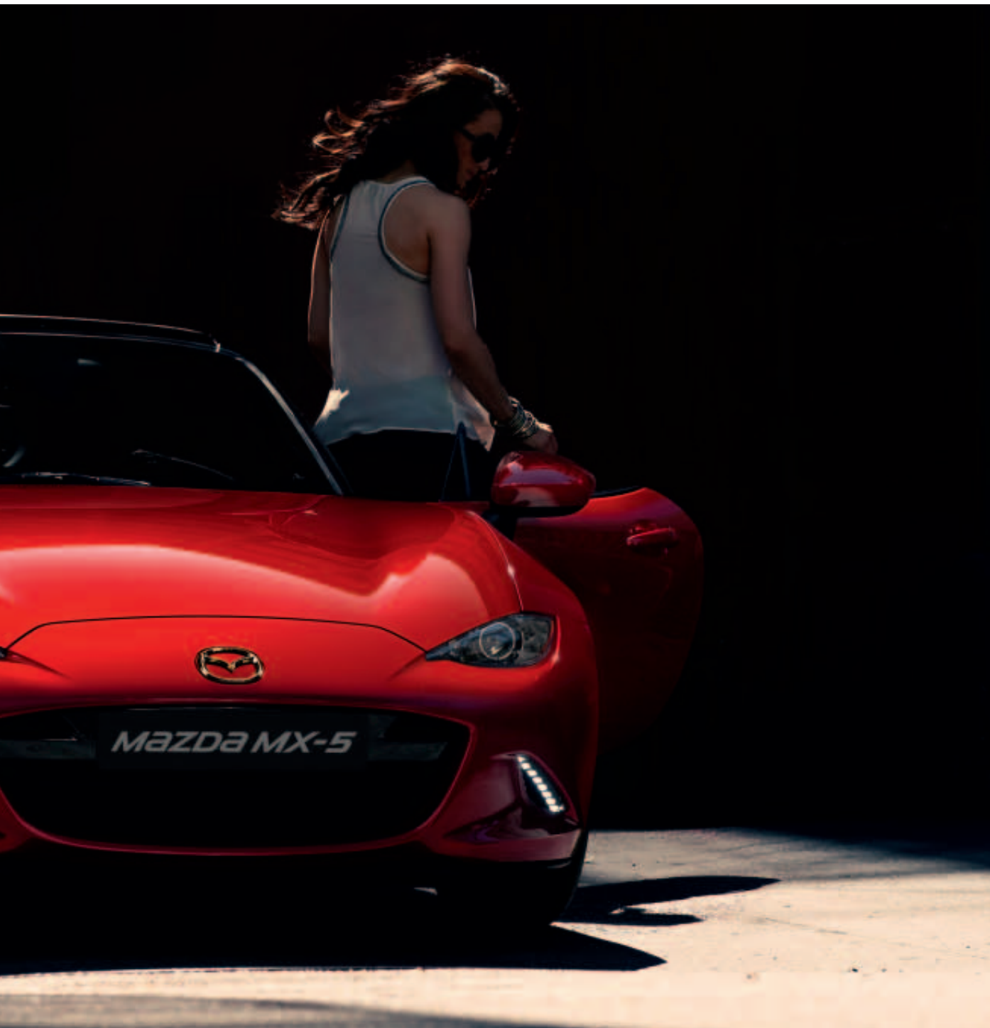
Foto links: Mazda MX-5 Roadster als GT-M uitvoering in Soul Red Crystal