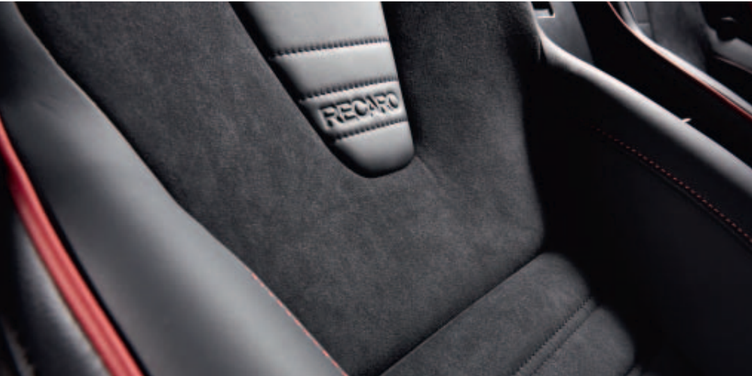
Foto links: Recaro-sportstoelen, zwart leder/Alcantara® met rode bies, optioneel op GT-M Foto rechts: Mazda MX-5 RF als GT-M uitvoering in Soul Red Crystal

Ervaar ultiem rijplezier in de Mazda MX-5 RF. Een legendarische roadster die op iedereen een onvergetelijke indruk maakt. Bij de nieuwe Mazda MX-5 hoeft u niet te lang stil te staan. De MX-5 is niet voor niets ontworpen voor zijn rijplezier. U wilt meteen instappen. En zodra u achter het stuur plaatsneemt, ervaart u het unieke gevoel van eenheid dat wij Jinba Ittai noemen. De RF, wat staat voor Retractable Fastback, is uitgerust met een inklapbare hardtop die is vormgegeven zonder concessies te doen op het design. Met een druk op de knop verandert u de MX-5 RF van sportieve coupe naar een open rij-sensatie.