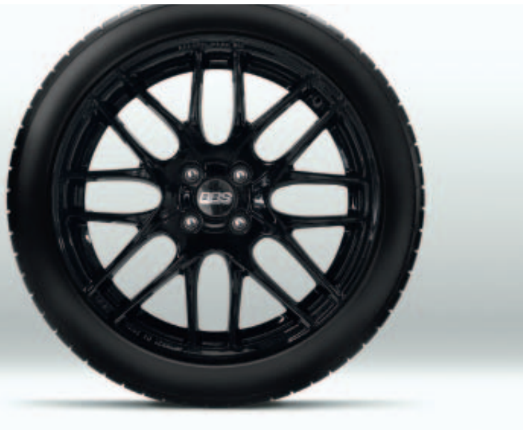
17-inch zwarte lichtmetalen BBS-velgen (enkel voor Skyactiv-G 184)

Met veel zorg heeft Mazda dealeropties ontworpen die perfect bij uw Mazda MX-5 passen. Ga voor een volledige lijst met originele Mazda dealeropties voor de Mazda MX-5 naar onze website.