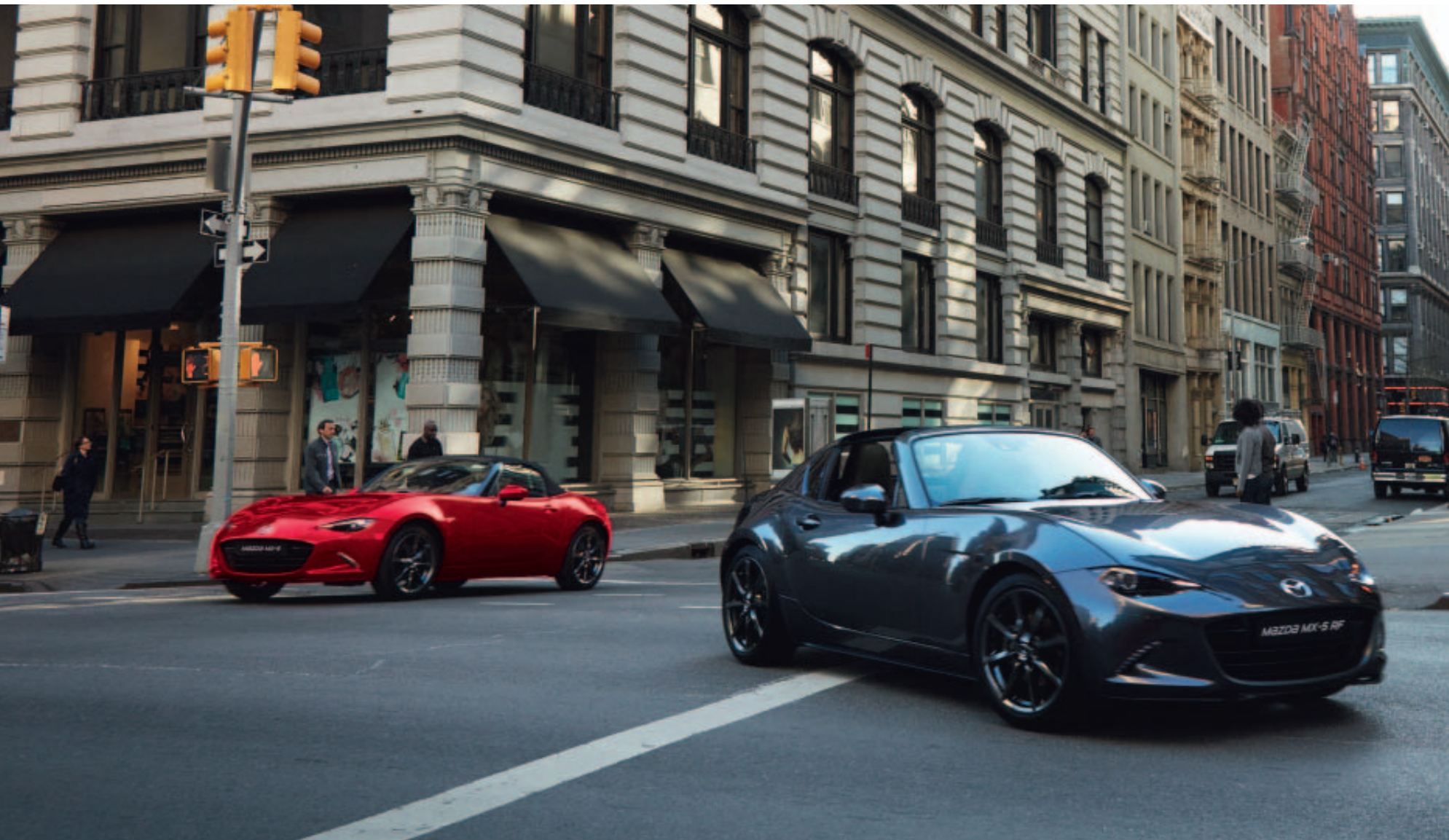
Foto: Mazda MX-5 RF als GT-M uitvoering in Machine Gray en een Mazda MX-5 Roadster als GT-M uitvoering in Soul Red Crystal