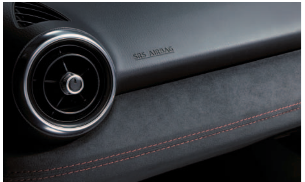
Dashboard bekleding in Alcantara®